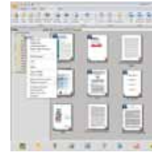
The PaperPort SE14 main screen

- La elección profesional para organizar y compartir sus Documentos