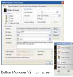
The Button Manager V2 main screen

Button Manager V2 facilita el proceso de escanear y enviar sus documentos a sus destinos favoritos con sólo presionar un botón. La nueva versión viene con una innovadora característica que le permite escanear y enviar automáticamente el archivo a servicios populares como Google Docs, Microsoft SharePoint, o a un FTP. Además, iScan permite insertar la imagen escaneada o el texto reconocido (con un proceso OCR opcional) en su editor de texto preferido, como Microsoft Word para optimizar su flujo de trabajo.