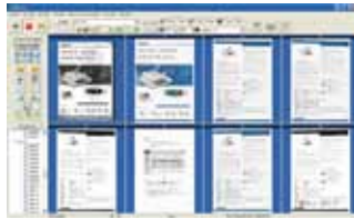
The AvScan 5.0 main screen

-La Herramienta inteligente para el manejo de sus escaneos